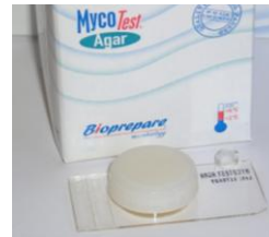
3. MYCOTEST AGAR 10 test Καλλιέργεια, ταυτοποίηση (μικροσκοπική) και αρίθμηση.