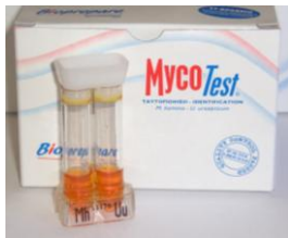
2. MYCOTEST 10 test Ταυτοποίηση (βιοχημική) και ημιποσοτικός προσδιορισμός.