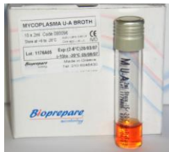
1. M. U-A 10 test Εμβολιασμός του δείγματος.

Για την εργαστηριακή διάγνωση των ουρογεννητικών Μυκοπλασμάτων M. hominis , U. urealyticum & M. fermentans . Περιλαμβάνει: 1) Το M. U-A , για τον εμβολιασμό του δείγματος. 2) Το MYCOTEST, για την ταυτοποίηση (βιοχημική) και ημιποσοτικό προσδιορισμό. 3) Το MYCOTEST AGAR, για την καλλιέργεια, ταυτοποίηση (μικροσκοπική) και αρίθμηση.